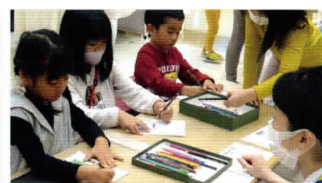
どこの国旗をぬろうかな？