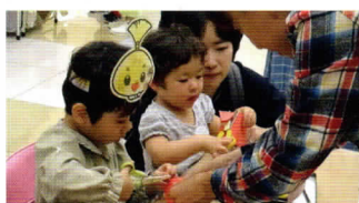
上手に切れるかな？

10月11～15日に『第8回みしま子育て支援フェア2023』がイトーヨーカドー三島店にて開催されました。そのイベントのひとつとして、14日(日)に「なるほど！姉妹・友好都市のお昼ごはん」をテーマにしたブースが設けられました。三島市の姉妹・友好都市で人気のお昼ご飯メニューを紹介すると共に、アメリカ・ニュージーランド・中国の国旗のぬり絵や中国の切り絵の体験、浙江省の名所を訪れている様なVR体験が用意され、来場した親子や大人も笑顔いっぱい楽しんで参加していました。