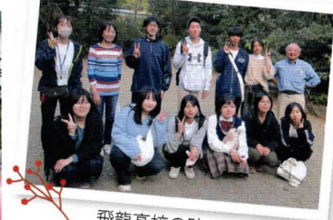
飛龍高校の助っ人