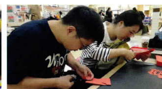
安徽省から来たふたりも中国の切り絵に挑戦！