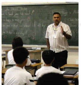
山田中での授業の様子