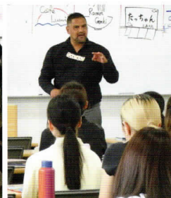
順天堂大学での授業の様子