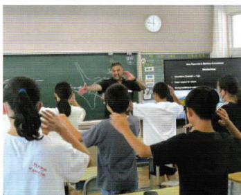
ハカを教わる長伏小の生徒ら