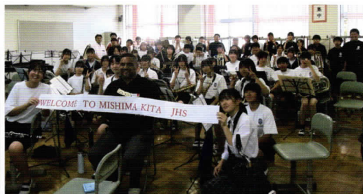
北中ではプラスバンドが歓迎セレモニーを