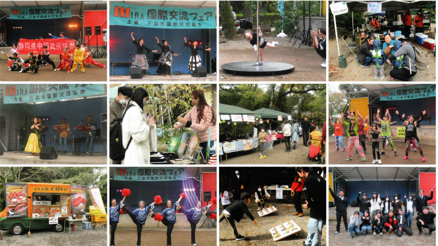
飛龍高校の助っ人

また、今回も飛龍高校の学生さんがボランティアでお手伝いをしてくださり、会場の設営・撤収や運営など、大助かりでした。