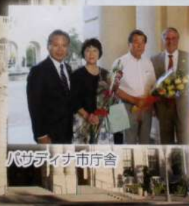
パサディナ市庁舎