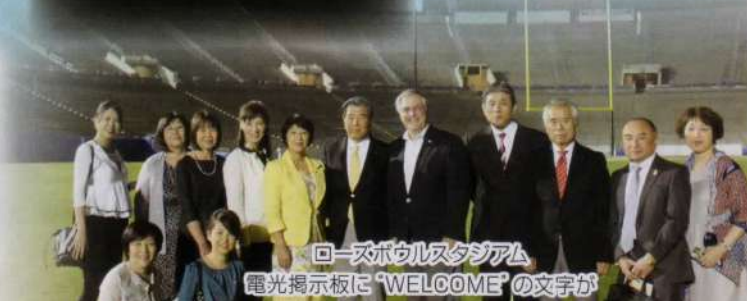
ローズボウルスタジアム 電光掲示板に「WELCOME」の文字が