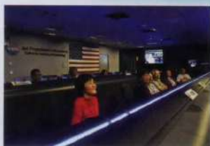
NASAジェット推進研究所