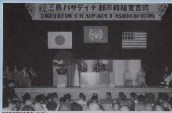
1957(昭和32)年「三島パサディナ都市縁組宣言式」の様子

2016(平成28)年から2017(平成29)年にかけて行われた60周年記念行事を振り返ります。