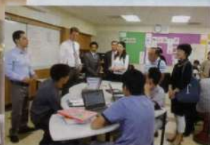
マーシャルファンダメンタル校