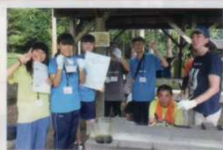
チンジャオロース班