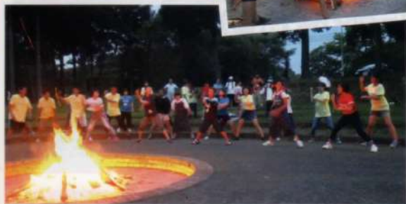
三島チーム 息のあったソーラン節

2002年、三島と米国姉妹都市パサディナとの青少年交流事業として始まった「フレンドシッププログラム」。隔年で両市を行き来する派遣事業を行っており、2012年から三島開催の折には、中国友好都市麗水からの学生も参加しています。