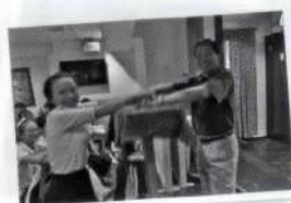
マジックで机が浮いたよ!