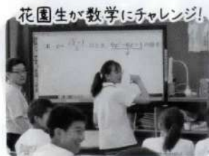
花園生が数学にチャレンジ!