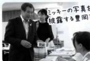
ミッキーの写真を 披露する豊岡市長