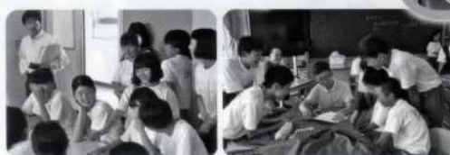
英語と携帯翻訳で必死にコミュニケーション