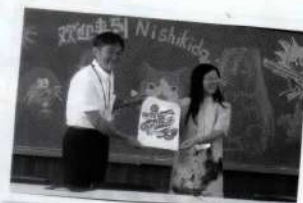
福田錦田中学校長と曾先生