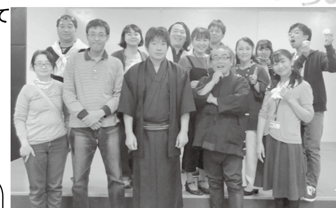
第92回公演「万華鏡の玉手箱」より

☆公演の案内をDMでお知らせしますので、是非アンケートへのご記入をお願いします☆