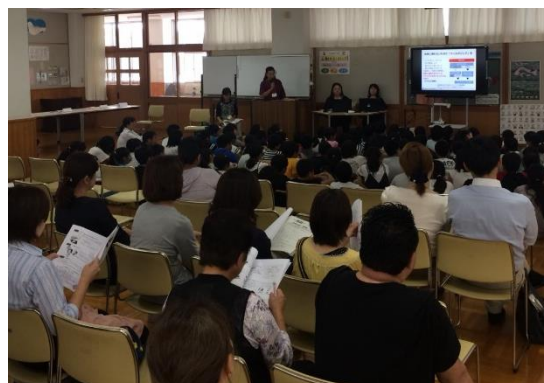
▲錦田小学校の様子